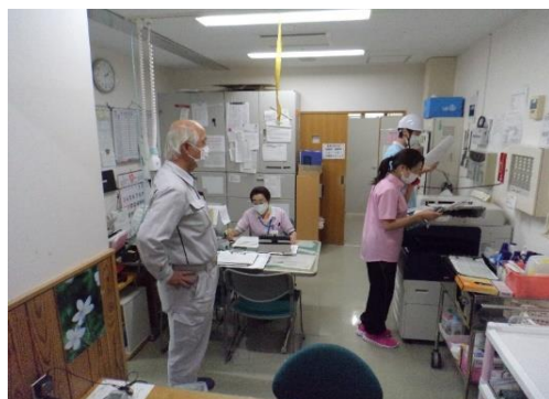
秋の防災訓練 2021.10.20 2Fステーションにて通報訓練