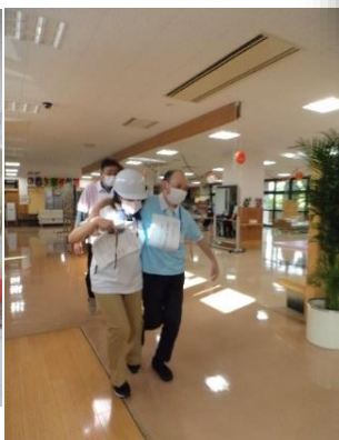
救護・避難誘導訓練